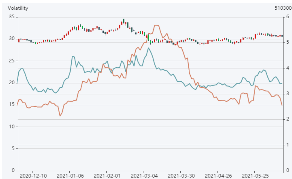
图 3：沪深 300 波动率指数

从市场波动率来看，上周市场波动率在 5 月底冲高后开始回落，总体维持在震荡下跌的状态。A 股市场在 5 月底大幅度拉升后市场情绪开始回落，上周沪深 300 期权波动率震荡下跌（图 3）。