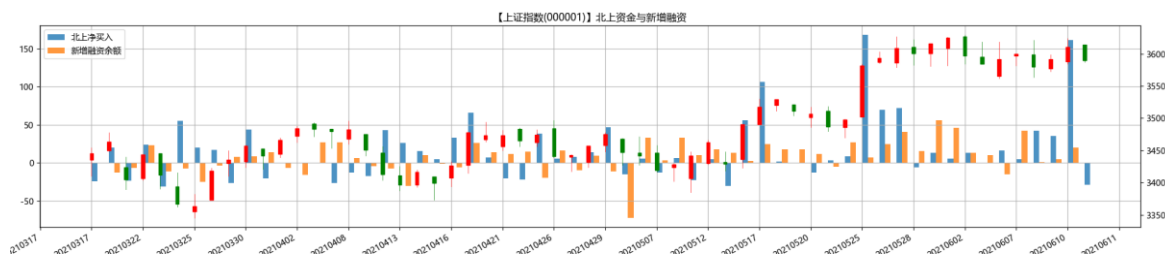
图 2：北向资金与新增融资

29.31 亿，其中沪股通流入 24.04 亿，深股通流入 5.27 亿。从两融资金表现来看，上周市场在震荡过程中杠杆资金表现趋于谨慎，流入略微缩减。