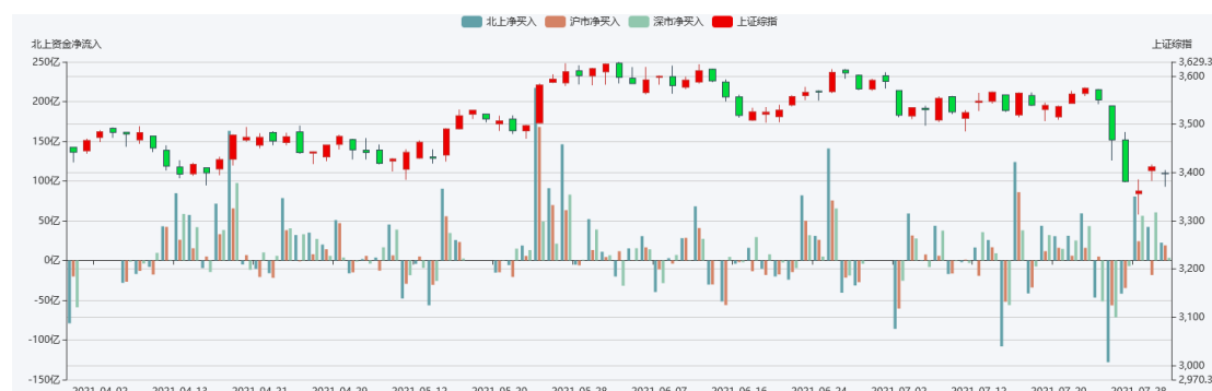
图 2：北向资金与新增融资余额

从资金流动来看（图 2），上周北向资金净流出不少，全周合计流出 24.46 亿，其中沪股通流出 66.07 亿，深股通流入 41.62 亿。从杠杆资金表现来看，上周新增融资总体下降较多，杠杆资金情绪收敛明显。