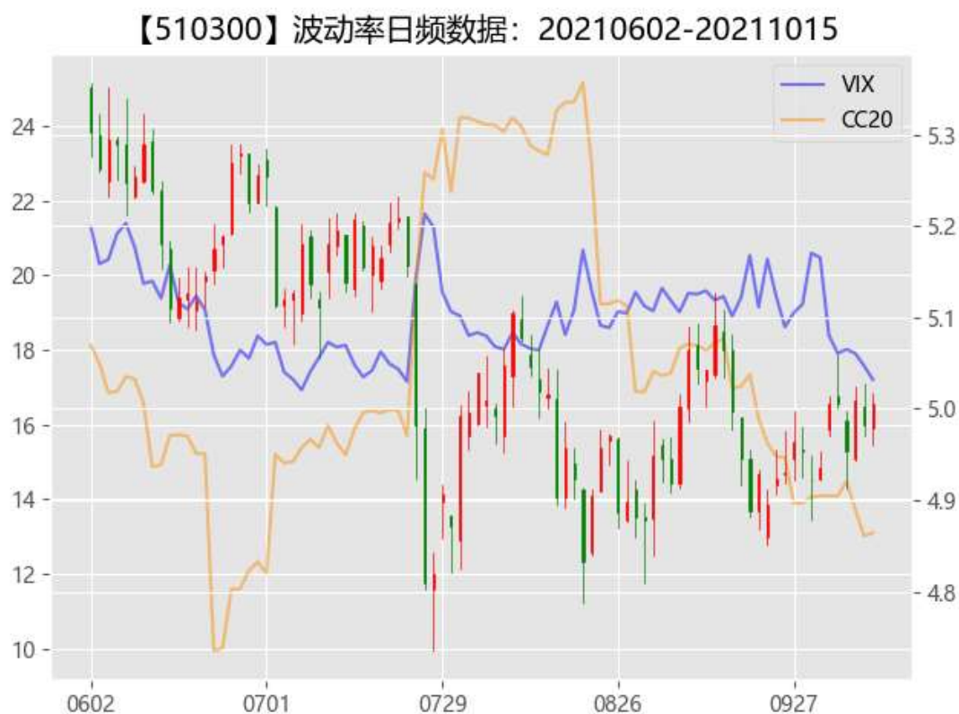
图 2：期权市场隐含波动率

从资金流动来看，北向资金为净流入状态，合计流入 15.01 亿，其中沪股通流入 37.56 亿，深股通流出 22.54 亿。现货市场窄幅震荡下沪深 300、上证 50 股指期货出现升水状态，隐含波动率大幅度快速回落。另外，金融市场正在按部就进一步开放，上周五证监会宣布合格境外投资者可以投资商品期权、股指期权等套保工具。相关 A 股套保工具还有 10 月 18 日在港交所上市交易的 MSCI 中国 A50 指数期货。