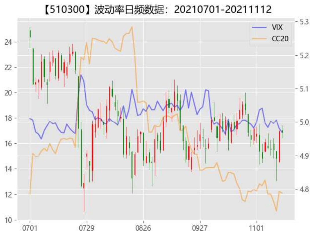
图 2：期权市场隐含波动率

荡上行，沪深 300、上证 50 隐含波动率均大幅度回落。近期可能引发的冲击事件纷纷落地，风险指标进一步下降，而且在低位震荡已经有较长时间，投资者要特别小心市场可能出现方向选择进而引发一波震荡，期权市场投资者谨慎卖空波动率。