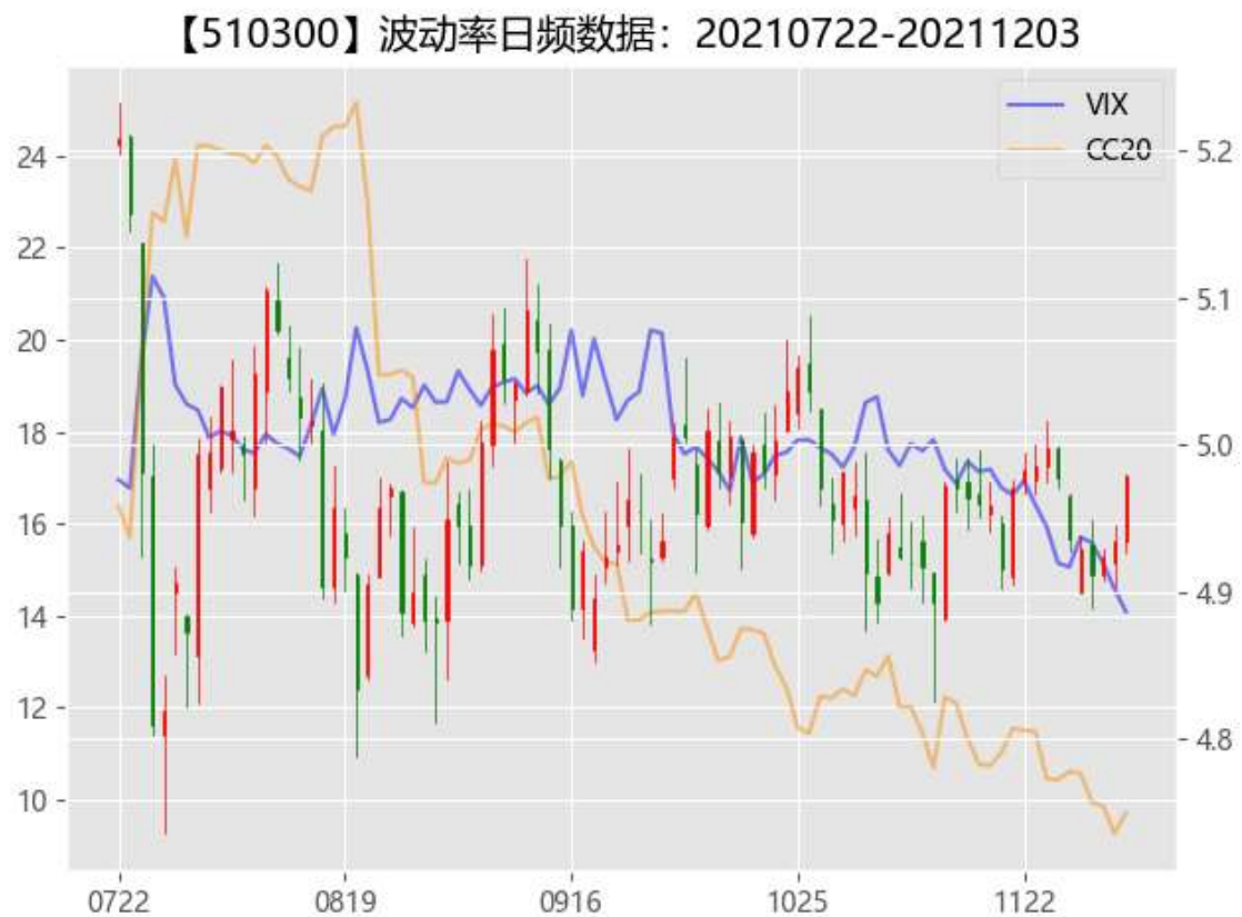
图 2：期权市场隐含波动率

从资金流动来看，北向资金维持在净流入状态，全周合计流入 151.17 亿，其中沪股通流入 115.70 亿，深股通流入 35.47 亿。现货市场维持窄幅震荡下，沪深 300、上证 50 隐含波动率继续大幅度回落，维持在历史新低。南非出现的新冠变异病毒对疫情的影响尚无法得出确定的结论，我国目前受到该病毒影响有限，但临近年底各地可能加强防疫措施，或许会对服务型消费复苏有压制效应。市场持续性弱波动运行，期权市场投资者应该谨慎卖空波动率，谨防可能出现事件性冲击引发市场大幅度震荡。