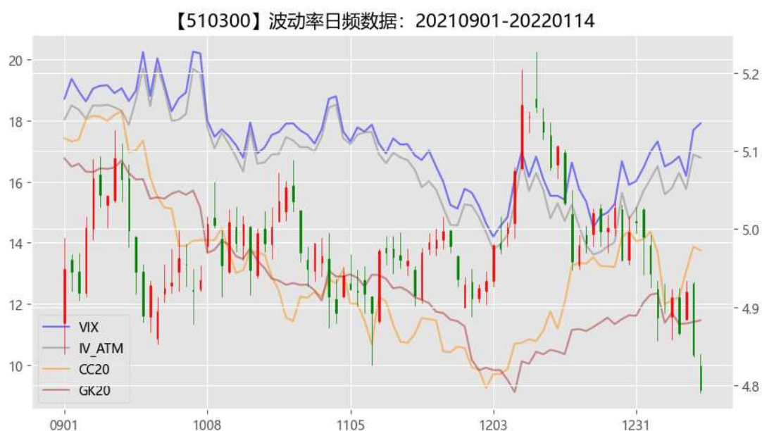
图 2 期权市场隐含波动率

从资金流动来看，北向资金上周为净流入，全周合计流入 74.45 亿，其中沪股通流入 74.65 亿，深股通流出 0.2 亿。股票市场快速回撤，市场情绪受到一定侵扰，隐含波动率在下跌行情中出现小幅度拉升。2022 年的观点从研究分化到市场实际分化开始，一年之际在于春，我们依然提醒投资者，在期待跨年行情的时候请注意风险。