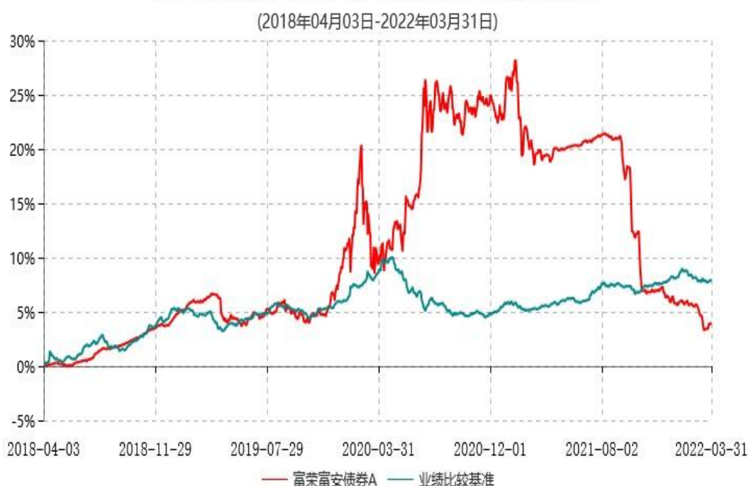
富荣富安债券A累计净值增长率与业绩比较基准收益率历史走势对比图