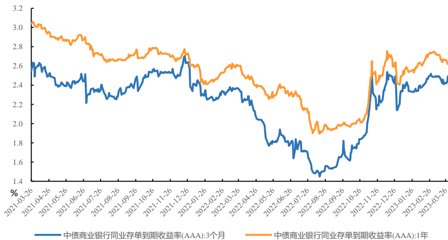
图 2、CD 到期收益率下行