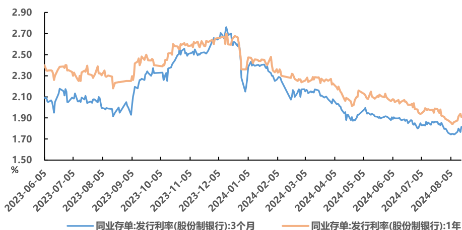
图 1、存单一级发行利率

上周同业存单净融资额回升，发行利率回升。8月12日-8月16日同业存单发行总额为4343亿元，较前一周增加887亿元，总偿还5748亿元，净融资为-1406亿元，净融出小幅减少491亿元。发行利率方面，1月期、3月期、6月期、9月期、1年期发行利率分别变动+8.33bp、+7.00bp、+3.60bp、+9.00bp、+5.00bp至1.850%、1.815%、1.967%、1.910%、1.910%。二级市场方面，3M、9M、1Y期股份行存单发行利率分别较8月9日上行7.0bp、9.0bp、5.0bp至1.82%、1.91%、1.91%，而6M期股份行存单发行利率分别较8月9日下行2.0bp至1.80%。AAA级1年期存单到期收益率累计上行4.2bp至1.93%。